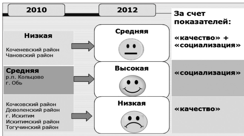
Рисунок 1. Группы районов, изменившие результативность, 2010–2012 гг.

Нормативно и методически оформленная практика оценки эффективности муниципальных систем образования является важной частью РСОКО Новосибирской области. Она позволяет учитывать динамику из-